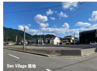
Ben Village 現地