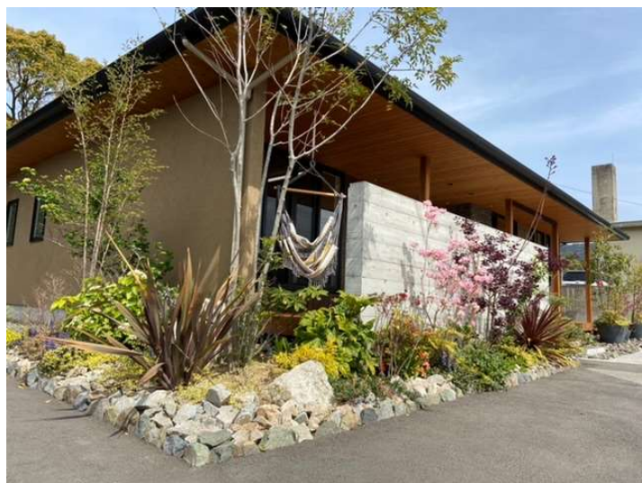
※写真は全て弊社施工写真